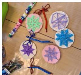
Kultur, kreativitet, rekreasjon