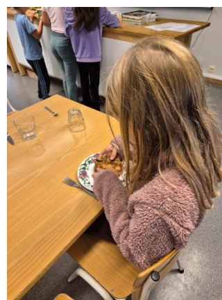
mat og måltidsglede