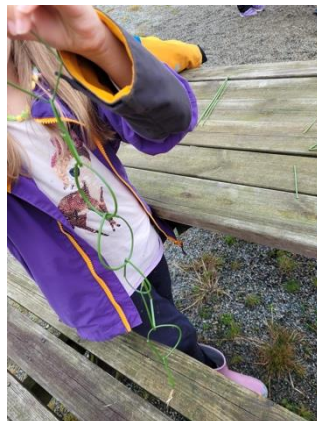
Tur, leik og kreativitet