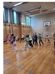
Fysisk aktivitet og rørsleglede