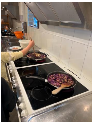
Matgruppe 2/3/4 trinn

Sist måned gjorde vi mange kjekke ting på SFO, her kan de lese om og sjå bilde av nokre av aktivitetane våre :-)