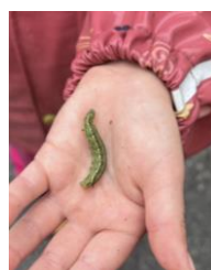
nysgjerrigheit, utforsking og naturopplevingar