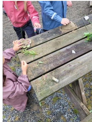
Tur, leik og kreativitet