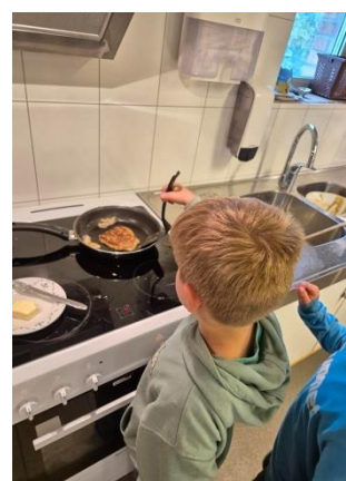
mat, måltidsglede, mestring