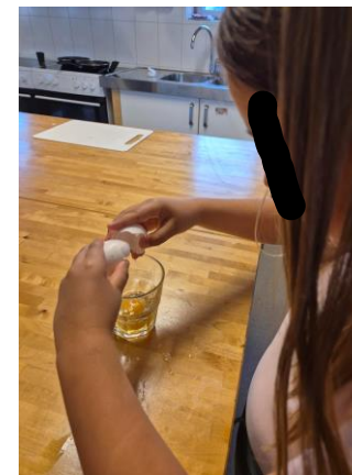
mat, måltidsglede, mestring