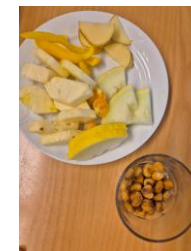
mat og måltidsglede