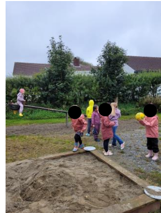
fysisk aktivitet og rørsleglede