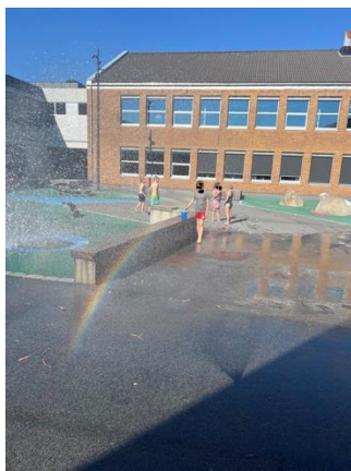
Leik, rekreasjon og gøy