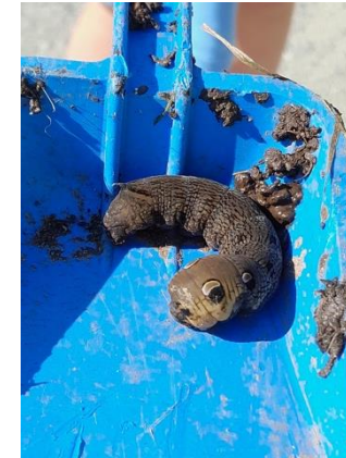
nysgjerrigheit og utforsking